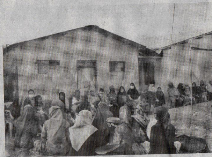
ANTUSIAS. Warga penerima bantuan sembako antusias mengikuti acara bakti social yang digelar HIMAFIL bersama Pondok Pesantren Syariful Anam dan Yayasan Wani Amal.